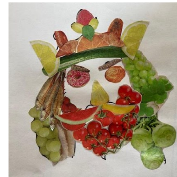
Koláž a la Arcimbollo

Breakoutové místnosti umožnily žákům zlepšit jejich jazykové a digitální dovednosti. Každý den projektu ukončilo školní kolo mezinárodní soutěže Master chef, v rámci které studenti představili a připravili (naživo či ze záznamu) typické pokrmy dané země. Tak jsme měli možnost společně uvařit české bramboráky a bábovku, španělskou Paellu či italské tiramisu.