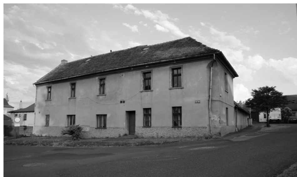
Číslo popisné 1 v dnešní době