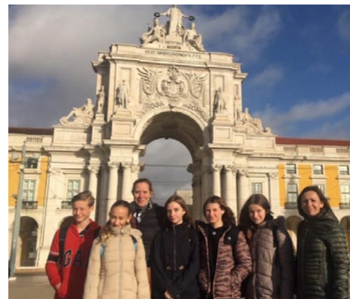
Leden 2019, Lisabon

Vzhledem k dlouhému období omezujícímu cestování naživo jsme ve dnech 10. až 14. května zorganizovali první virtuální mobilitu projektu. Virtuální mobilita do Itálie, která nesla název „Jídlo skrze lokální a národní identitu“, se věnovala typickému jídlu jednotlivých států a s ním spojeným tradicím.