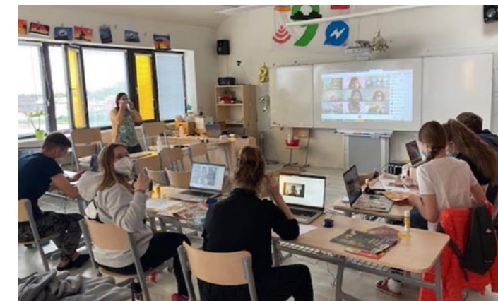
Virtuální mobilita do Itálie (květen 2021)

Studenti každý den pracovali v rámci breakout rooms v mezinárodních skupinkách. Připraveny byly aktivity jako např. únikové místnosti v Gravině, rapové písně popisující typické jídlo a tradice zapojených států, Kahoot kvízy, digitální hádanky na portrétech Arcimbolda apod.