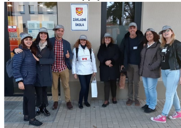
Učitelé z Itálie, Španělska, Portugalska a Polska v ČR (Říjen 2019)

Projekt HOME (Historic Origins in Modern Era) probíhá ve spolupráci s Itálií, Portugalskem, Španělskem a Polskem a odstartoval již na podzim 2019. Po úspěšném výjezdu žáků současného devátého ročníku do Portugalska a návštěvě zahraničních učitelů u nás na škole jsme byli nuceni kvůli epidemii Covid 19 aktivity projektu odložit.