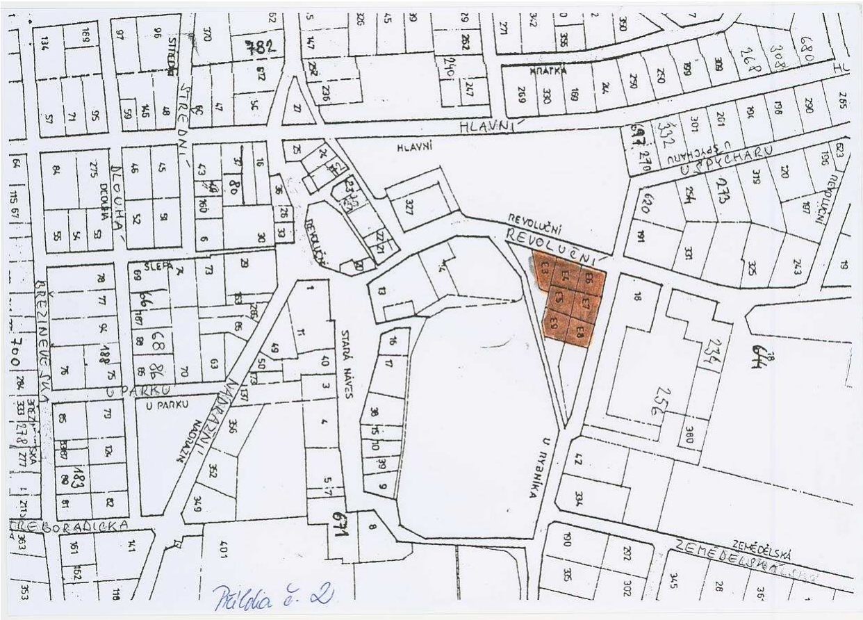
Příloha č. 2