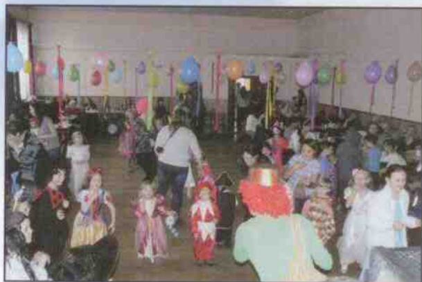
Dárky a hračky pro Den dětí Otovice