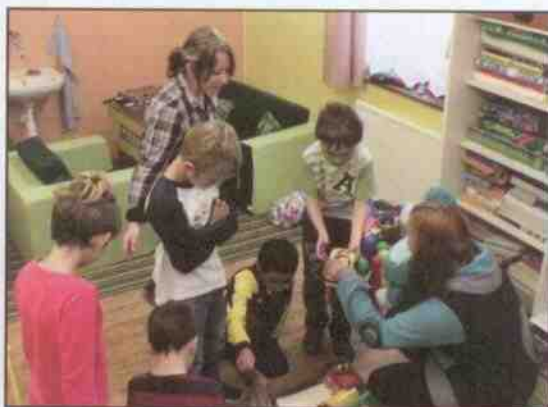
Hračky a pomůcky pro speciální školu v Broumově