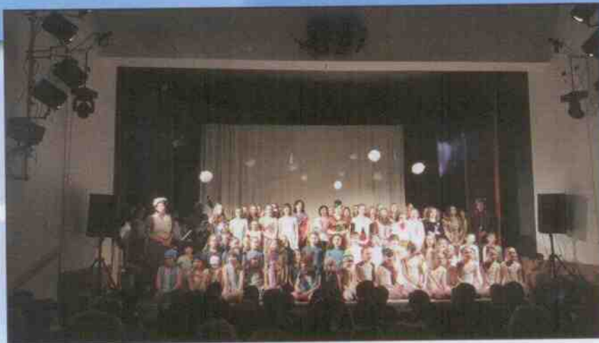
Muzikál Sněhová královna v Polici nad Metují Oblečení pro herce darovala Diakonie,