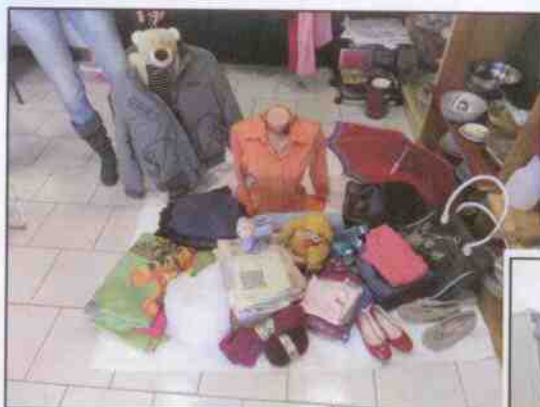
Vytříděná materiální pomoc pro jednu rodinu z Náchoda