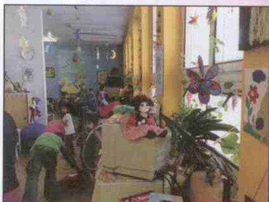
Hračky a školní potřeby pro děti z MŠ – uprchlický tábor Bělá pod Bezdězem