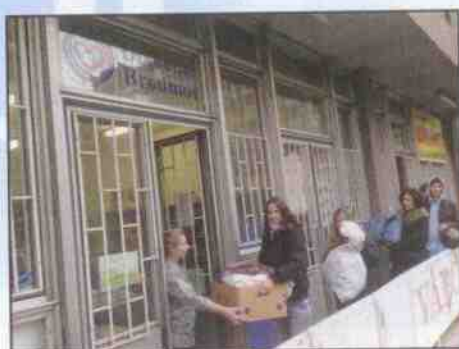
Sběrné a výdejní středisko v Praze

Nejefektivnější a nejadresnější forma sběru je uspořádání sběru použitého šatstva zástupci měst a obcí, organizacemi, spolky, zájmovými organizacemi, církvemi, charitami a dalšími.