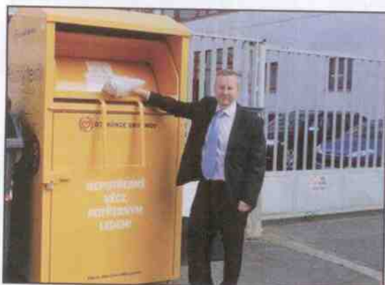
Ministr Životního prostředí – Mgr. Richard Brabec u kontejneru Diakonie umístěného u MŽP

Díky podpoře Státního fondu životního prostředí, jsme mohli realizovat dva projekty na separaci použitého textilu - zakoupili jsme 300 kontejnerů na textil, nákladní auto a manipulační vysokozdvizný vozík.