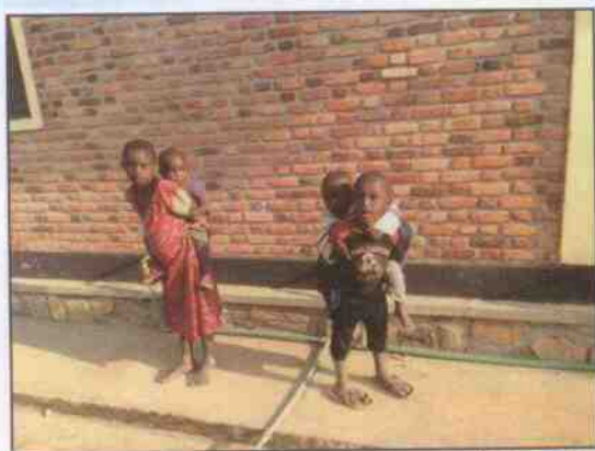
Pomáháme zlepšit život dětem v Africe