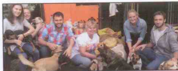
Diakonie Broumov ve spolupráci se studenty Gymnázia Jana Palacha v Praze darovala do útulku Praha 8 Libeň granule, deky a plyšáky

Pomoc Diakonie Broumov směřovala i do útulku Praha 8 Troja