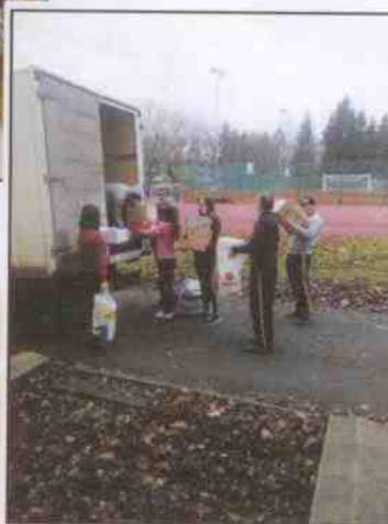
Děti ze Základní školy v Mariánských Lázních udělaly sbírku a pomohly ji nanosit i do auta.